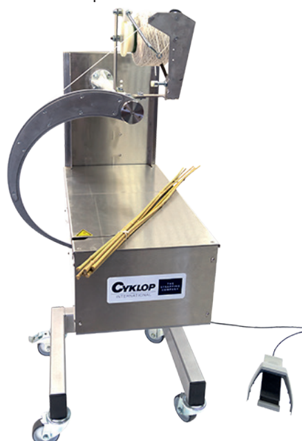
*De afgebeelde elastiekbinder is een rechter binder. Dit betekent dat de producten van links naar rechts worden ingevoerd.

< KLIK HIER VOOR EEN VIDEO VAN DE MD 35/60 XL >